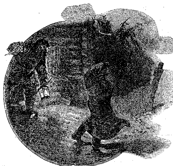
«Τὴν τετάρτην πρωϊνὴν ὥραν...» (Σελ. 306, στ. α΄.)

πιστοῖ τοῦ Νικολέφ, οἱ ὅποιοι κατηγοροῦν τώρα τὸν Κρόφφ, καὶ ἐβεβαίωσαν ὅτι αὐτὸς ἐδολοφόνησεν τὸν Πός, καὶ αὐτὸς μετὰ τὴν ἀναχώρησιν τοῦ ταξιδιωτοῦ, διὰ νὰ ἐνοχοποιηθῆ ὁ ἀθῶος, ἐποδοβήτησεν εἰς τὸ δωμάτιόν του τὸν συνδουλιστήρα, καὶ αὐτὸς ἀνέμιξε μὲ τὴν στάκτην τῆς ἐστίας τὸ τεμάχιον τοῦ χαρτονομισματος, τὸ ὁποῖον δὲν παρετηρήθη κατὰ τὴν πρώτην ἔρευναν. Ἐκ τούτου ἐπιεται ὅτι πᾶν ὅ,τι ἐκέρδιζεν εἰς τὴν ὑπόθεσιν ὁ Νικολέφ, τὸ ἔχανε ὁ Κρόφφ. Ἐν τούτοις ἐπερίμενον, ἠλπίζεν ἀκόμη ὅτι ἡ ἐμφάνισις τῶν κλοπιμαίων χαρτονομισμάτων θὰ ἐπειθεν, ὀριστικῶς αὐτὴν τὴν φοράν, ὅτι δολοφόνος καὶ κλέπτης ἦτο ὁ Νικολέφ ἄλλ' ὁ Βλαδίμηρος Γιαν-