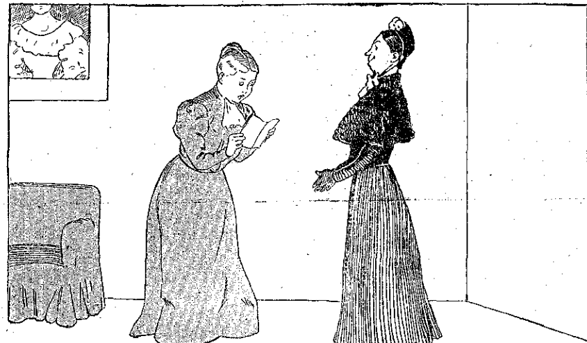
«Καί ὁμως εἶνε ἀλήθεια...» (Σελ. 308, στ. α'.)

ΚΥΡΙΑ ΛΕΜΟΝΗ, βγάζουσα τὸ κεφάλι τῆς καὶ ὑπαγορεύουσα εἰς τὴν Ἰδα Ρόζαν :— Ἀναισχύντως!..