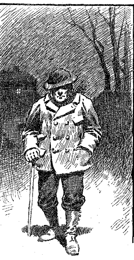
Έβιάζετο να φθάση εις τó Φολγκέτον... (Σελ. 313, στ. α')

Περιεργό! έσυλλογίσθη κύπτων. Άπό μακρυνά αυτός ο μπόγος έμοιαζε με άνθρωπο. Τι να έχη μέσα; Και συγχρόνως έβύθισε τήν χείρα εις τόν σωρν τών ρακών εκείνων... Έξα- φνα άνατρίχιασε... Εΐχε ψάσση κάτι θερ-